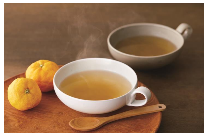
「アゴユズスープ」イメージ