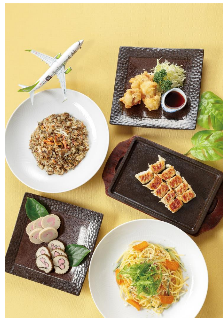
アラカルトメニュー一例