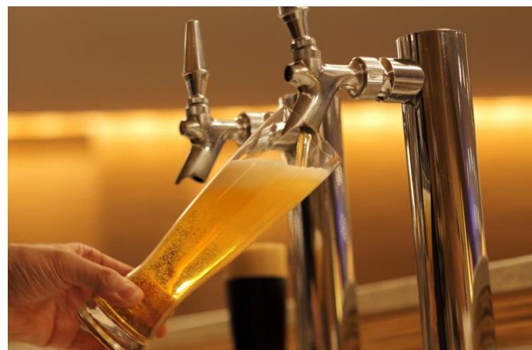
ドリンク提供イメージ