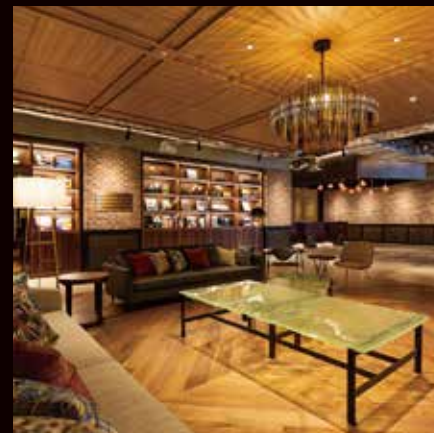
渋谷ストリームエクセルホテル東急

鉄道9路線が乗り入れる渋谷駅に直結し、スクランブル交差点を望む客室を擁するシティホテル。好アクセスが喜ばれる会議やセミナー開催などは大小さまざまな7つの宴会場でご対応が可能です。最上階のレストランには接待にも適した個室をご用意しています。客室にはレディス専用フロアもご用意し、ビジネスや観光の滞在を安心して過ごしていただける環境を整えています。