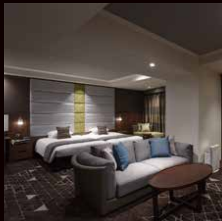
渋谷エクセルホテル東急

都会の喧噪を離れ、桜丘町の落ち着いたロケーションに建つ高層タワーホテル。スイートルーム14室を含む客室は全408室。コンベンションやレセプションに適したバンケットルームや、多彩なラインアップのレストランと個性あふれるバーが人気。能楽堂やジャズクラブなどのエンタテインメントも充実しています。世界中のVIPご滞在受け入れ可能なスベックと空間でお迎えいたします。