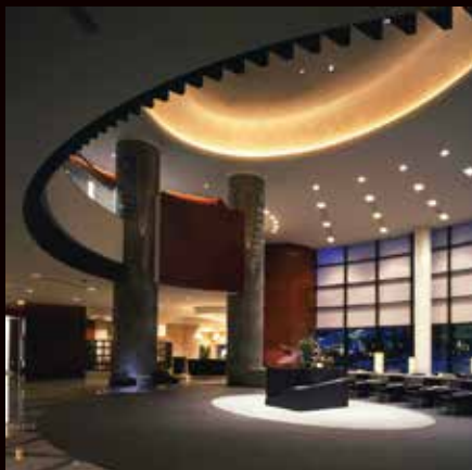
セルリアンタワー東急ホテル